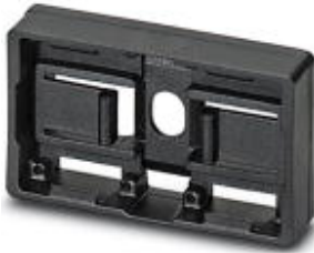
Schildchenträger, schwarz, unbeschriftet, Montageart: Schrauben, Nieten, Schriftfeldgröße: 27 x 15 mm

Bitte beachten Sie, dass die hier angegebenen Daten dem Online-Katalog entnommen sind. Die vollständigen Informationen und Daten entnehmen Sie bitte der Anwenderdokumentation. Es gelten die Allgemeinen Nutzungsbedingungen für Internet-Downloads. ( http://download.phoenixcontact.de )