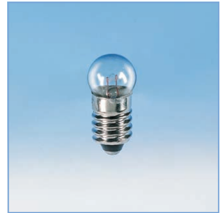
VPE 10 Stück