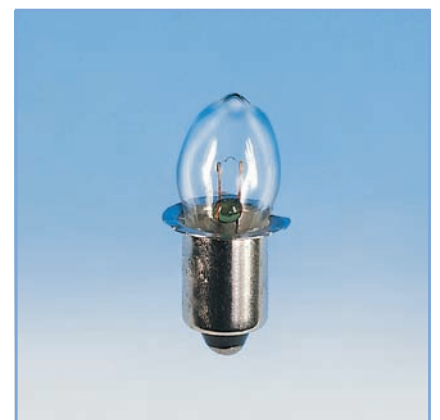
VPE 10 Stück