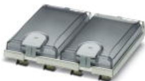
Einbaurahmen, für 2 Frontplatten oder Steckdose, Metallrahmen, matt vernickelt, elektrisch leitend, transparenter Deckel

Bitte beachten Sie, dass die hier angegebenen Daten dem Online-Katalog entnommen sind. Die vollständigen Informationen und Daten entnehmen Sie bitte der Anwenderdokumentation. Es gelten die Allgemeinen Nutzungsbedingungen für Internet-Downloads. ( http://download.phoenixcontact.de )