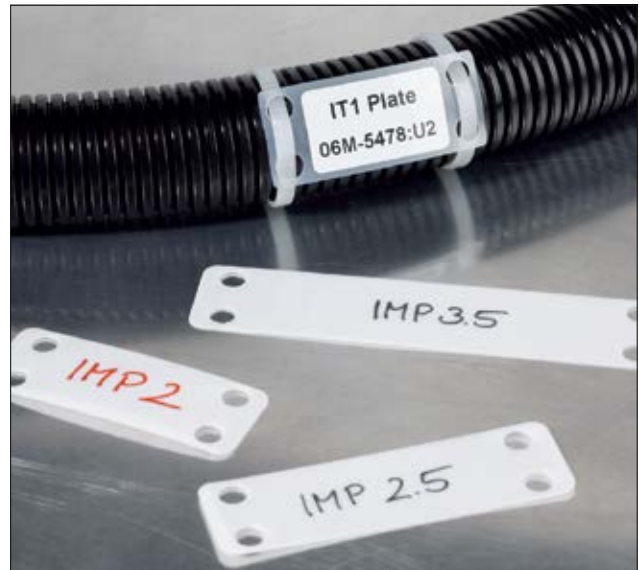
Deutliche Lesbarkeit bringt Sicherheit.