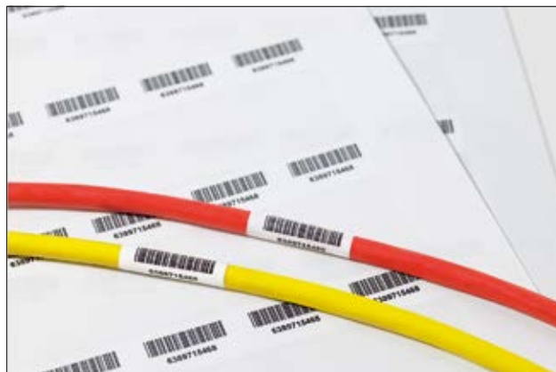
Helatag sorgt für die dauerhafte Kennzeichnung von Kabeln mit Barcodes.