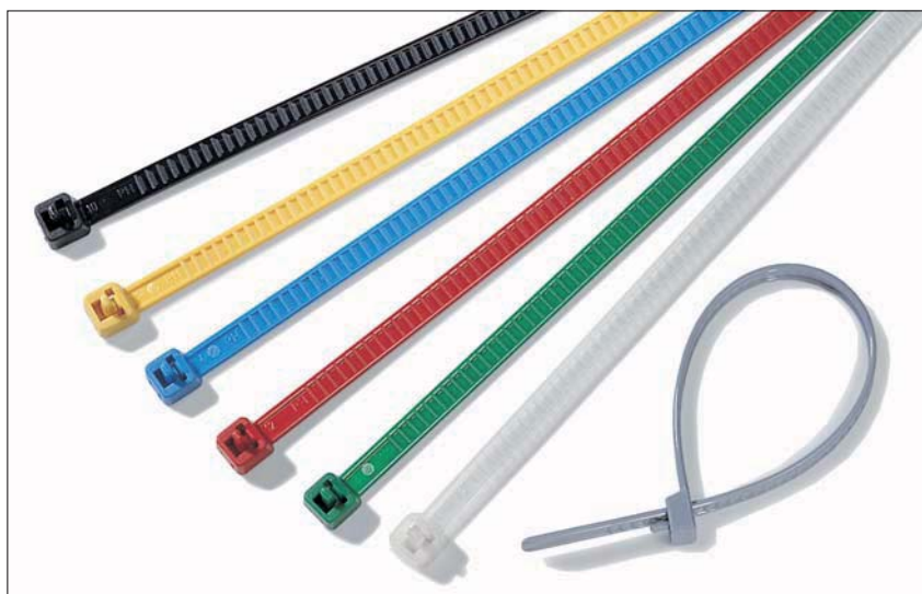
Les colliers de couleur LR55 sont adaptés au repérage et peuvent être réutilisés.

Utilisés dans de nombreuses industries, ces colliers démontables et réutilisables, conviennent parfaitement pour les installations temporaires ou pour du repérage.