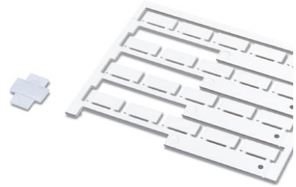
Abbildung zeigt die Varianten PKT und PKE

http://eshop.phoenixcontact.fr/phoenix/treeViewClick.do?UID=0803977