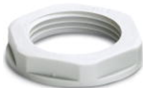
Protimatice, PA 6 GF 30, pro závit M20 x 1,5, barva: světle šedá RAL 7035

Upozorňujeme, že zde uvedené údaje pocházejí z online katalogu. Úplné informace a údaje naleznete v uživatelské dokumentaci. Platí všeobecné podmínky použití pro stahování z internetu. ( http://phoenixcontact.de/download )