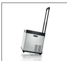
Ausziehbare Teleskopstange und Rollen