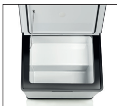
Volumen ca. 17 Liter