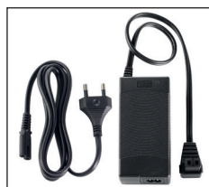
Netzteil für die Steckdose