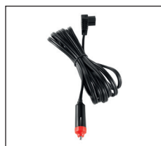
12V/24V DC Anschlusskabel